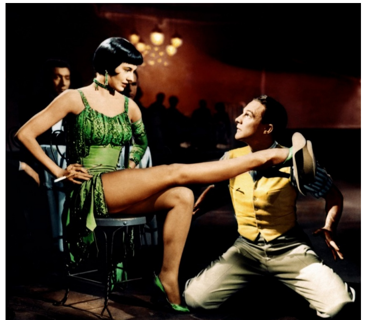
1951 CHANTONS SOSU LA PLUIE (Singin' in the Rain) de Gene Kelly et Stanley Donen avec Gene Kelly