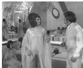
1977 LES 7 CITÉS DE L'ATLANTIS (Warlords of Atlantis) de Kevin Connor avec Doug McClure