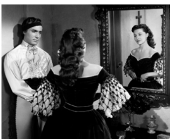
1951 LE SIGNE DES RENÉGATS (Mark of the Renegade) de H. Fregonese avec R. Montalban