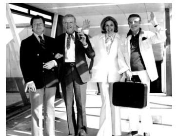
1978 THAT'S ENTERTAINMENT de J. Haley Jr avec D. O'Connor, Gene Kelly, Fred Astaire