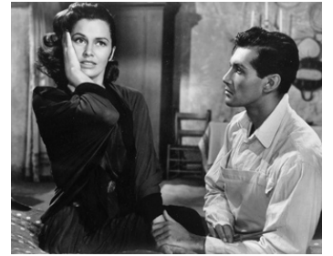
1942 SOMBRERO (Sombrero) de Norman Foster avec Vittorio Gassman