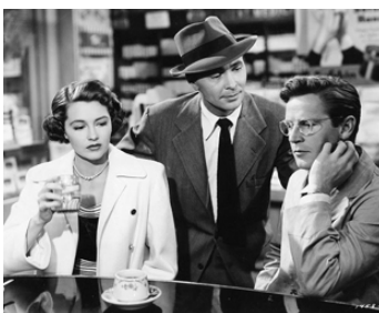
1949 TENSION (Tension) de John Berry avec Barry Sullivan, Richard Basehart