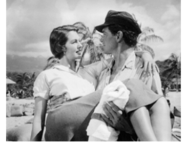
1958 CRÉPUSCULE SUR L'OcéAN (Twilight for the Gods) de Joseph Pevney avec Rock Hudson