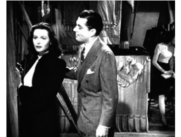
1946 THREE WISE FOOLS d'Edward Buzzell avec Warner Anderson