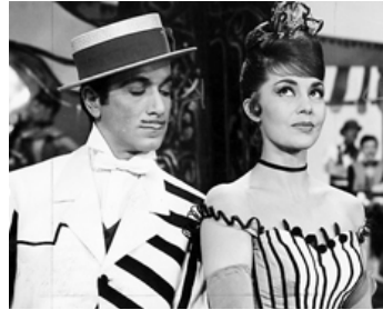
1960 LES COLLANTS NOIRS (Black Tights) de Terence Young avec Roland Petit