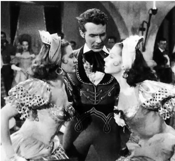
1948 LE BRIGANT AMOUREUX de Laslo Benedek avec Ricardo Montalban, Ann Miller