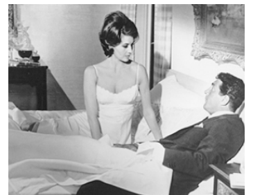
1965 MATT HELM AGENT TRÈS SPÉCIAL (The Silencers) de Ph. Karlson avec Dean Martin