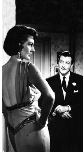
1959 TRAQUENARD (Party Girl) de Nicholas Ray avec Robert Taylor