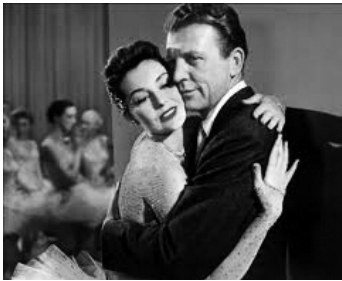
1955 VIVA LAS VEGAS (Meet me in Las Vegas) de Roy Rowland avec Dan Dailey