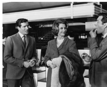
1963 ASSASSINAT À ROME (Il Segreto del vestito rosso) de Mario Zampi avec Hugh O'Brian