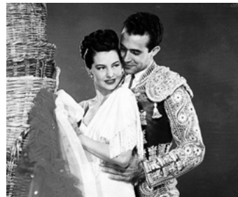
1947 SEÑORITA TORÉADOR (Fiesta) de Richard Thorpe avec Ricardo Montalban