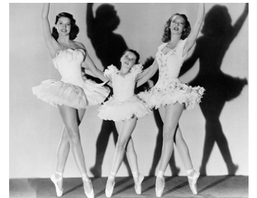
1947 THE UNFINISHED DANCE de Henry Koster avec Margaret O'Brien, Karin Booth