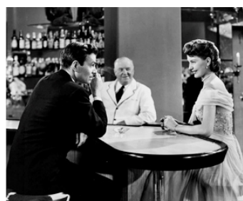
1949 VILLE HAUTE VILLE BASSE (East Side, West Side) de Mervyn LeRoy avec James Mason