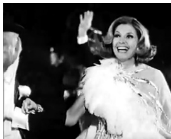
1976 WON TON TON LE CHIEN QUI SAUVA HOLLYWOOD (Won Ton Ton...) de M. Winner