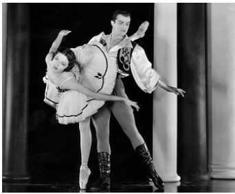
1943 MISSION À MOSCOU (Mission to Moscow) de Michael Curtiz avec Michael Panaieff