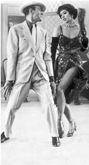
1952 TOUS EN SCÈNE (The last Wagon) de Vincente Minnelli avec Fred Astaire