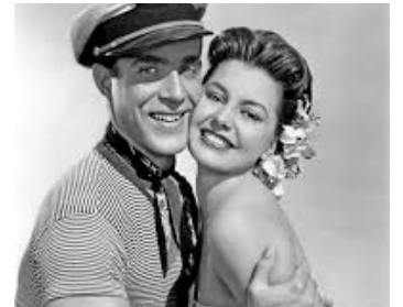
1948 SURUNE ÎLE AVEC TOI (On an Island with you) de Richard Thorpe avec R. Montalban