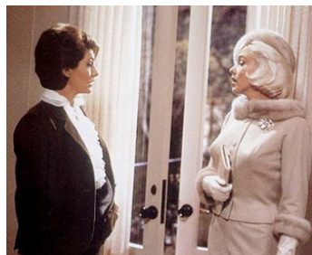
1962 SOMETHING GO TO GIVE de George Cukor (inachevé) avec Marilyn Monroe