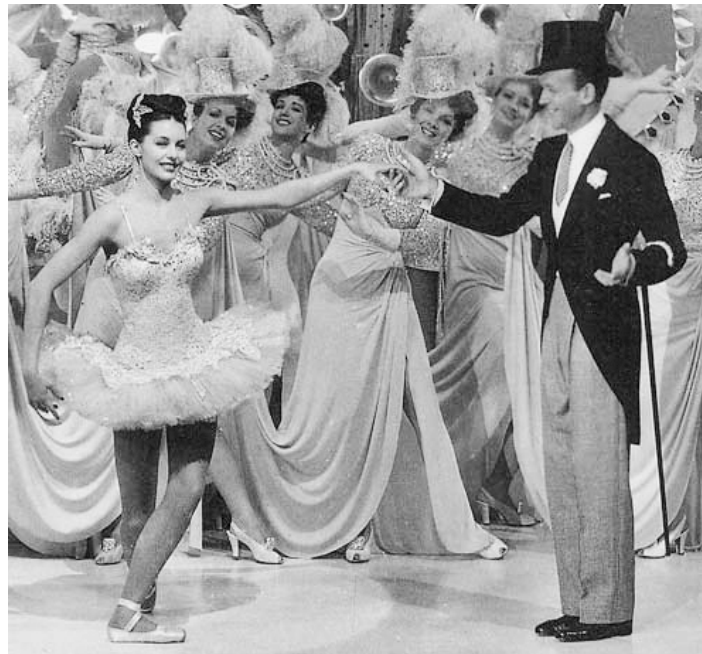
1946 ZIEGFELD FOLLIES (Ziegfeld Follies) de Vincente Minnelli avec Fred Astaire