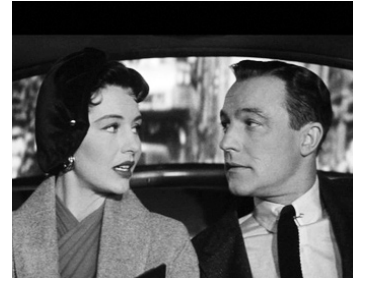
1955 BEAU FIXE SUR NEW YORK (It's always fair Weather) de S. Donen avec Gene Kelly