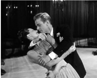
1946 LA PLUIE QUI CHANTE (Till the Clouds roll by) de Richard Whorf avec Gow»r Champion