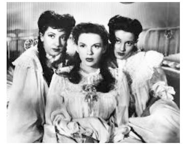
1946 THE HARVEY GIRLS de George Sidney avec Virginia O'Brien, Judy Garland