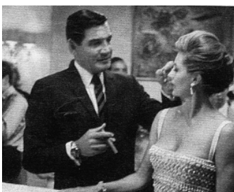
1976 MAROC DOSSIER N° 7 (Maroc 7) de Gerry O'Hara avec Gene Barry