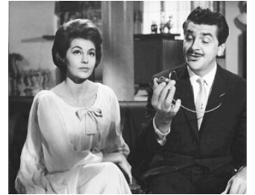
1961 FIVE GOLDEN HOURS (Cinq ore in contanti) de Mario Zampi avec Ernie Kovacs