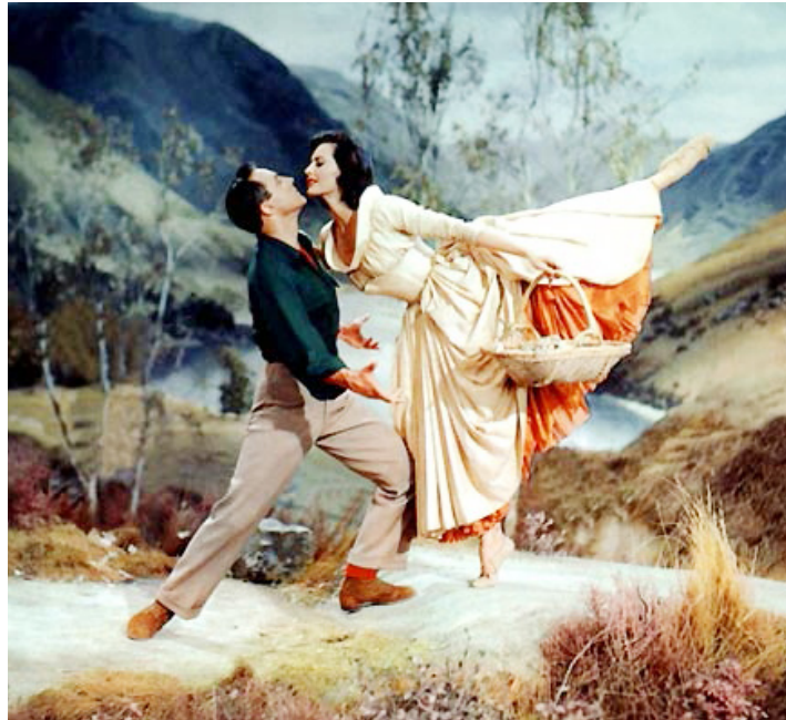
1954 BRIGADOON (Brigadoon) de Vincente Minnelli avec Gene Kelly