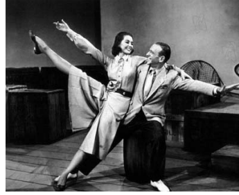
1957 LA BELLE DE MOSCOU (Silk Stockins) de Rouben Mamoulian avec Fred Astaire