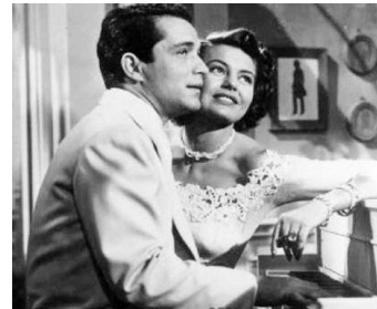
1948 MA VIE EST UNE CHANSON (Words and Music) de Norman Taurog avec Perry Como